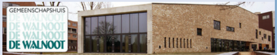
Gemeenschapshuis De Walnoot

Reginahof 1 5282 GC Boxtel 0411- 673485 www.dewalnootboxtel.nl email: dewalnoot@gmail.com